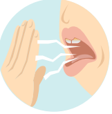
راحة الفم الكريهة