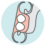
تغير قياسات أطقم الأسنان المتحركة (الكلية أو الجزئية)